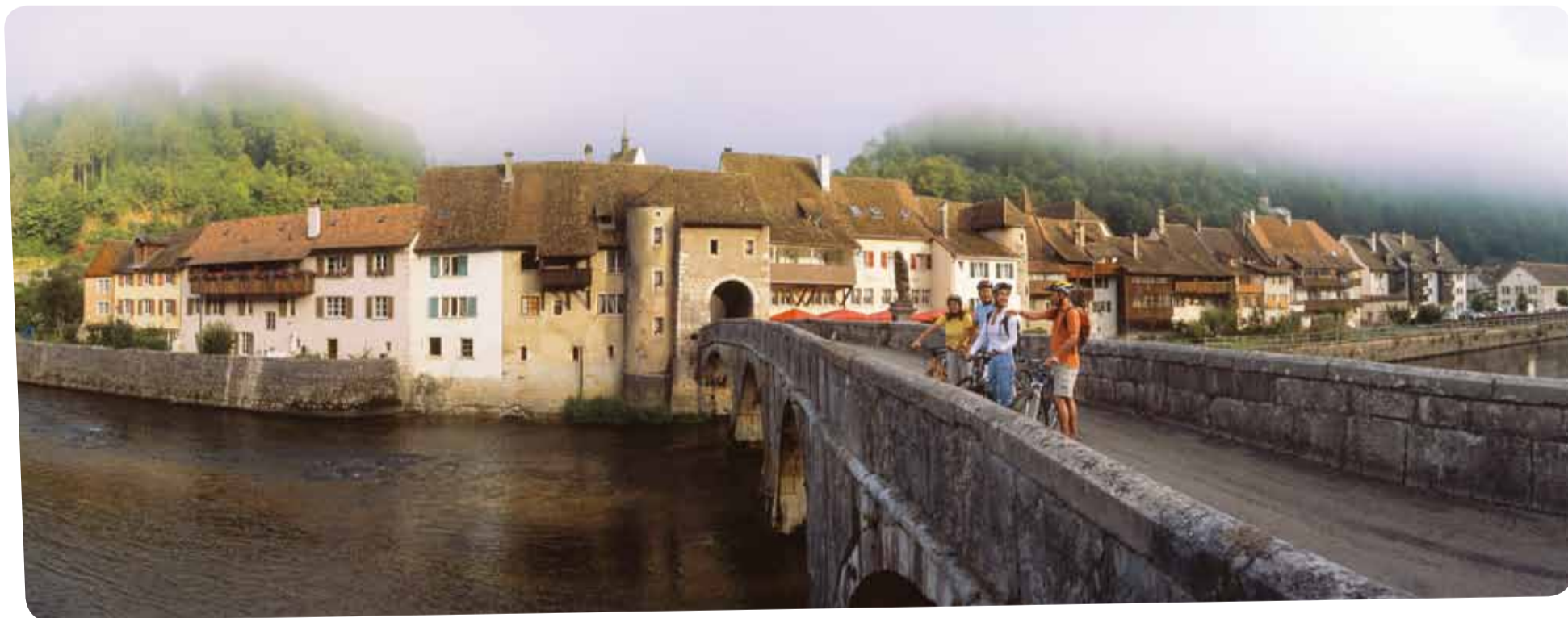
Les 19 communes concernées, ici Saint-Ursanne, devront approuver la charte du Parc.

La charte comprend trois volets: le contrat de Parc, le plan de gestion et les projets pour les quatre ans à venir.