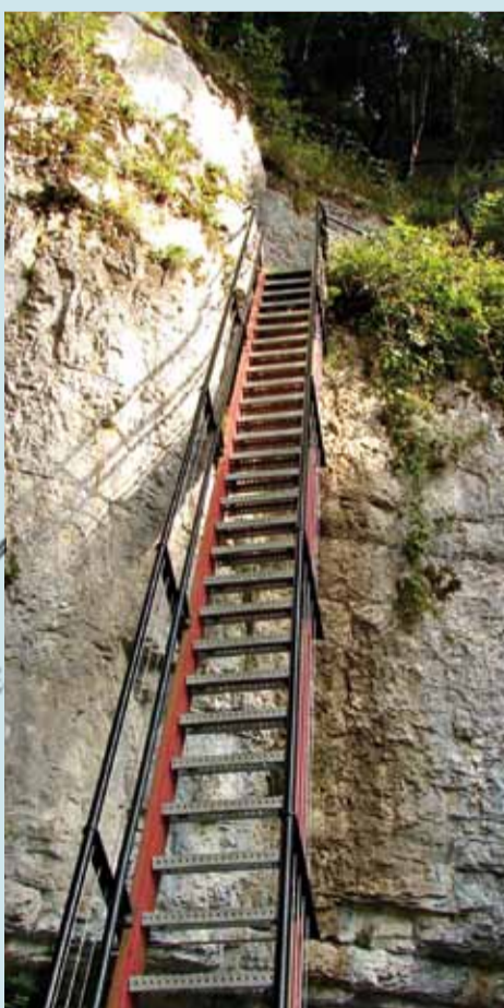
Le sentier de la bricotte passe par les échelles de la mort.