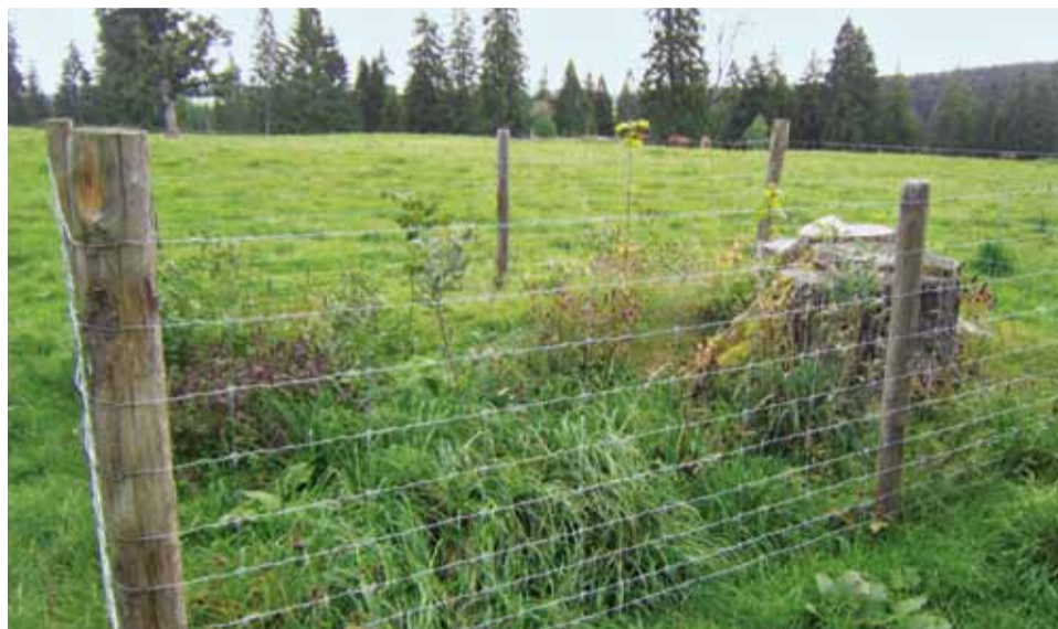
Des îlots d'arbres sont plantés et protégés du bétail afin de reboiser les pelouses.

Jean-Marie Aubry relève que le travail réalisé dans son village aura une influence sur toute la zone du Parc du Doubs puisque la quasi-totalité des communes sont concernées. Les habitants mais aussi les touristes bénéficieront des retombées du projet devenu réalité. Le Parc pourra assurer la promotion d'un paysage et d'une nature préservés.