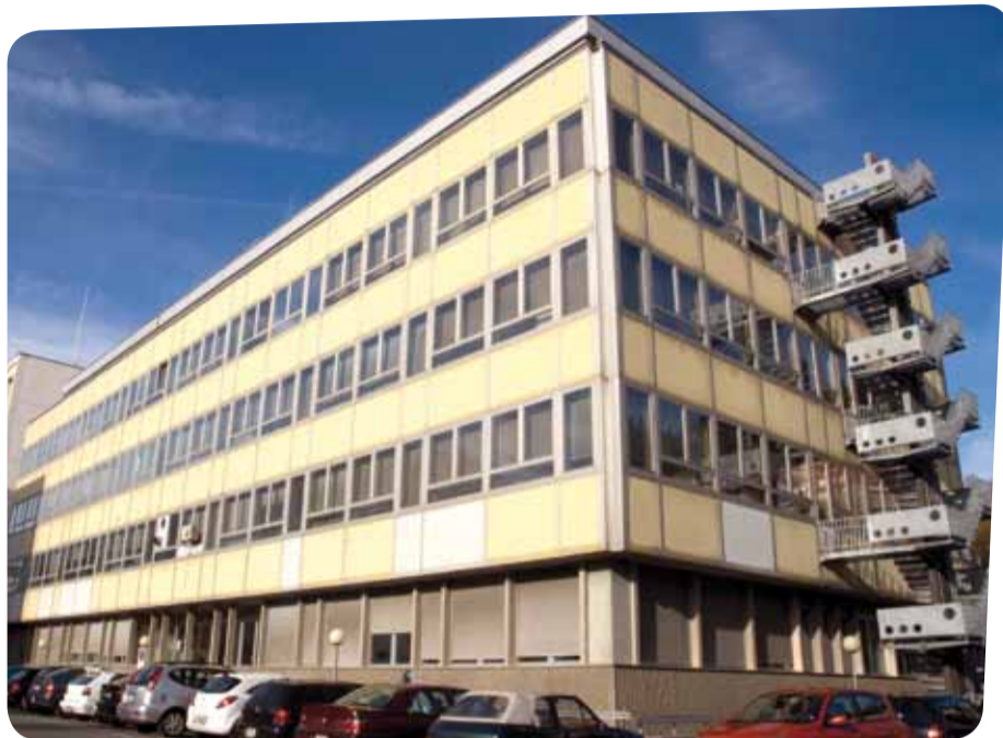
Institut d'horlogerie et de création du Locle

A quelques dizaines de kilomètres du Locle, le Lycée Edgar Faure de Morteau est aussi le Lycée des Métiers en Bijouterie & Horlogerie. Trois formations sont proposées. La première permet d'obtenir en deux ans le Certificat d'aptitude professionnelle (CAP); quarante-cinq élèves de 15 à 16 ans la fréquentent actuellement. Quinze élèves de 17 à 19 ans suivent la filière en deux ans pour l'obtention d'un BMA (Brevet des métiers d'arts); dans cette section, les élèves interviennent sur des montres compliquées et la réfection de pièces. Ces deux formations peuvent se faire en alternance, dans le sens de la formation duale que nous connaissons en Suisse (école et entreprise). Enfin, le Lycée Edgar Faure est le seul lycée français à offrir la possibilité d'obtenir un DMA (Diplôme des métiers d'art).